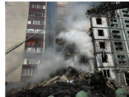
Умань, Черкасская область