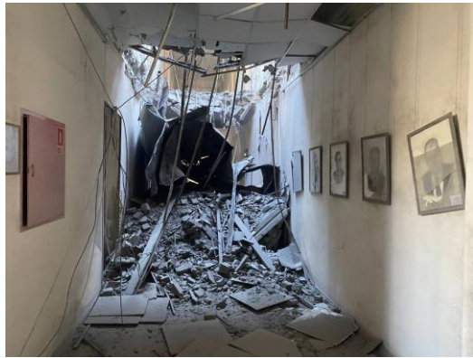
Nikopol, Dnipropetrovsk region